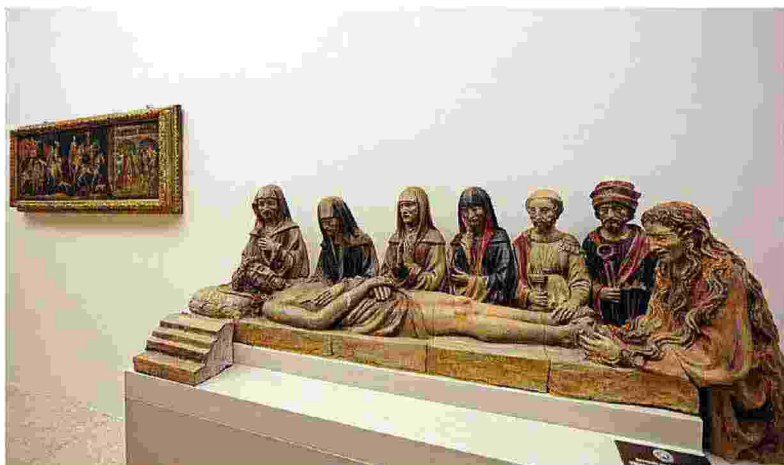
Un gruppo scultoreo raffigurante la deposizione che si trova alla fine del primo corridoio