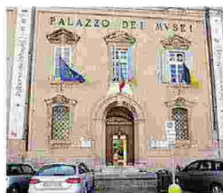
L'ingresso di Palazzo dei Musei