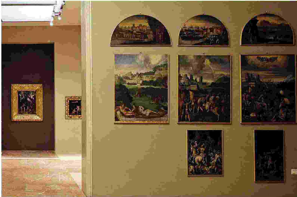
Un altro scorcio del museo con in evidenza i dipinti di Nicolò dell'Abate

di Modena si rivolse al fratello, cardinale Alessandro d'Este, per avere l'opera che l'anno seguente giunse in città trasportata su un carro trainato da buoi. Il ritratto a olio venne invece eseguito tra il 1638 e il 1639 quando Francesco I si trovava a Madrid ospite dei reali di Spagna.